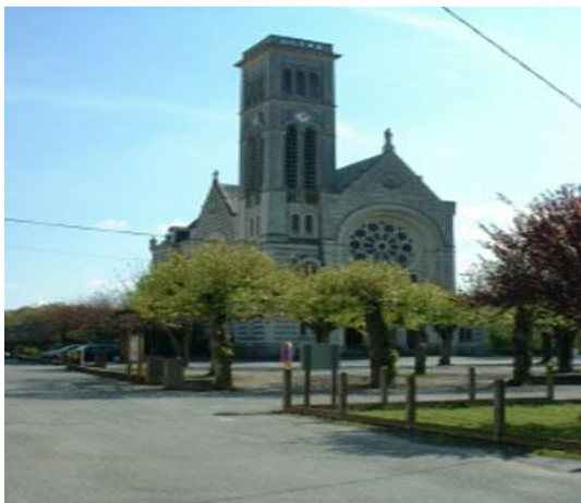
Notre Dame du Marillais