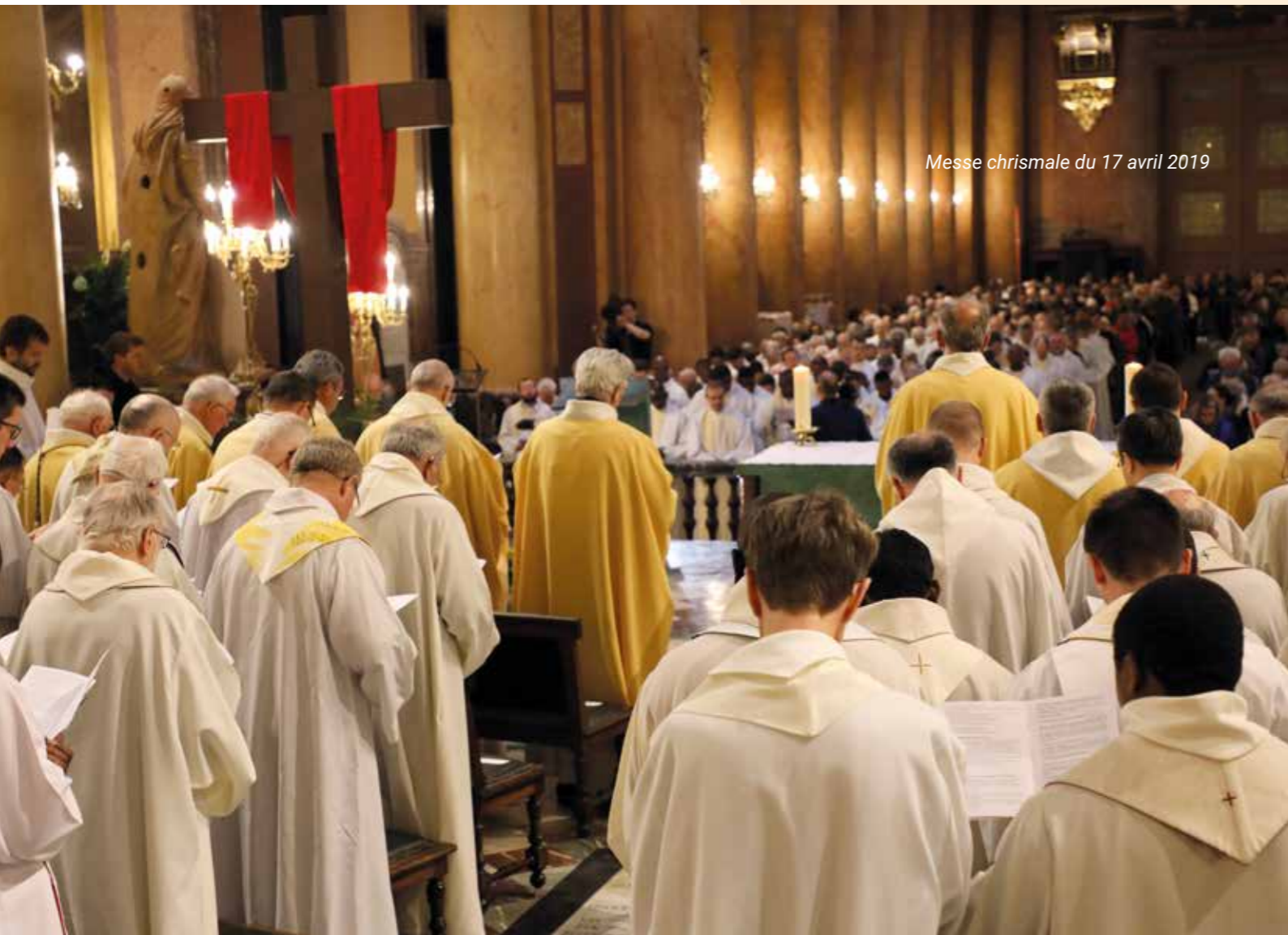
Messe chrismale du 17 avril 2019

Près d'une centaine de prêtres du diocèse de Rennes a participé à la formation sur la lutte contre les abus sexuels durant deux journées, en janvier et en mars 2019, abordant tous les aspects (psychologie, loi, pastorale) avec des experts et des témoignages. Depuis le printemps 2016, une cellule d'accueil et d'écoute a été constituée pour le Diocèse de Rennes avec un numéro de téléphone : 02 99 14 35 00. ●