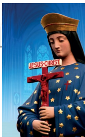
TRIDUUM DE CLÔTURE DU JUBILÉ DES 150 ANS